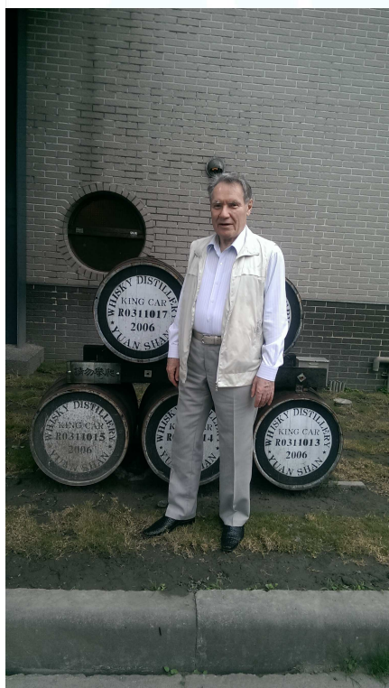
2014/3/25 攝於宜蘭金車酒廠